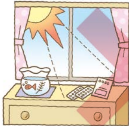
直射日光の あたる場所