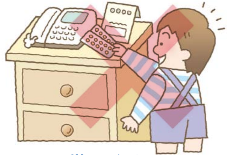
子供の手が 届く場所